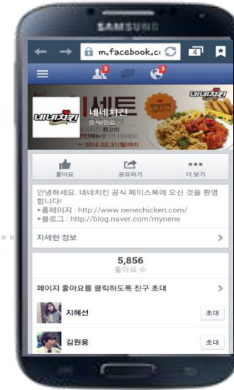
*SNS 랜딩 페이지를 통한 추가 노출 및 추가 바이럴 유도