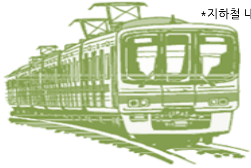
*지하철 내 실 집행 게시 사진(NFC스티커부착)