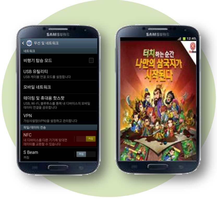
*NFC 접촉 후 모바일 랜딩 페이지 연결