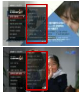
(해당 카테고리 내 영화 선택 시 독점노출)