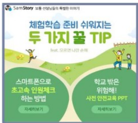
< 로그인팝업_B타입 >