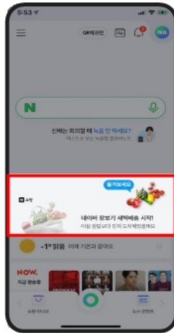
< 좌측 타깃 이미지 방향으로 사용자 드래그 >