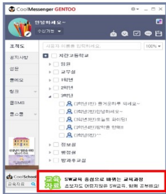
< 네이티브 광고 >