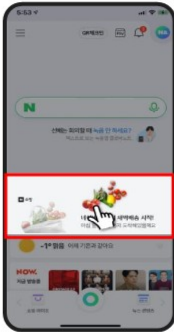
< 광고주 오브젝트와 모션 노출 >