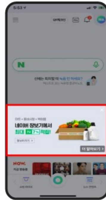
< 결합 이펙트와 함께 확장 >