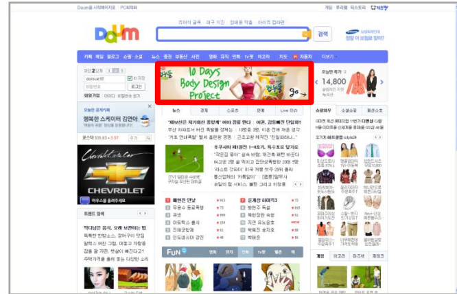
<다음 초기 상단배너>