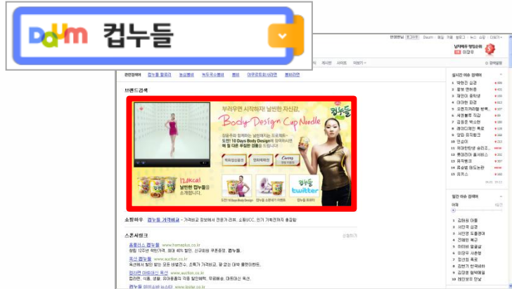
<다음 크로스미디어 & 브랜드검색>