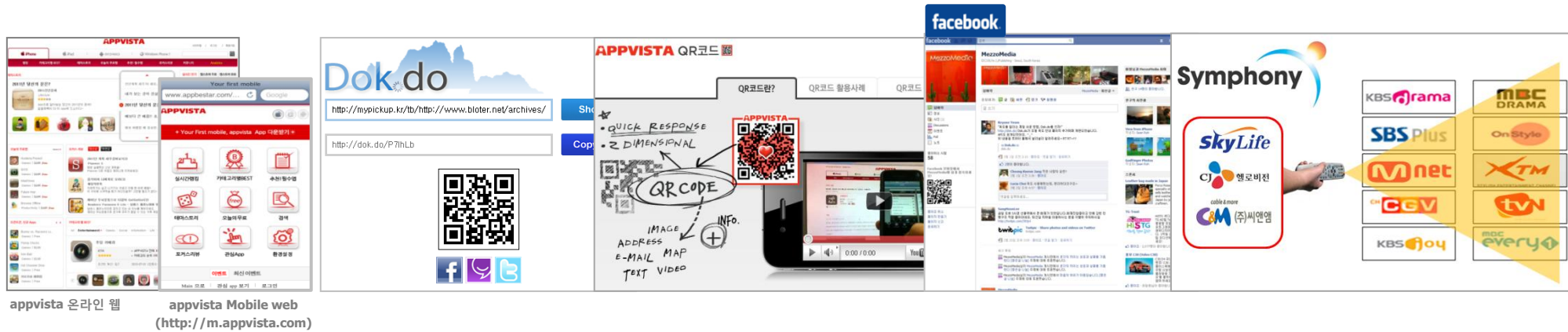
appvista 온라인 웹 appvista Mobile web http://m.appvista.com