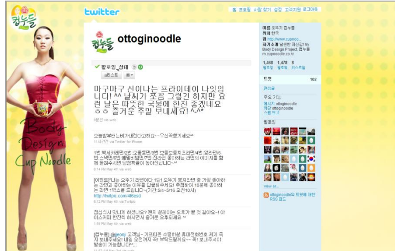
<트위터 이벤트 페이지>