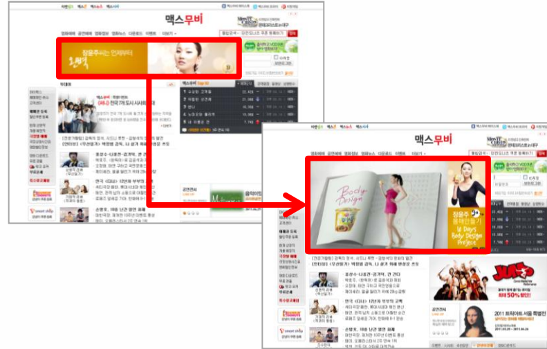
<맥스무비 메인 빅확장배너 >