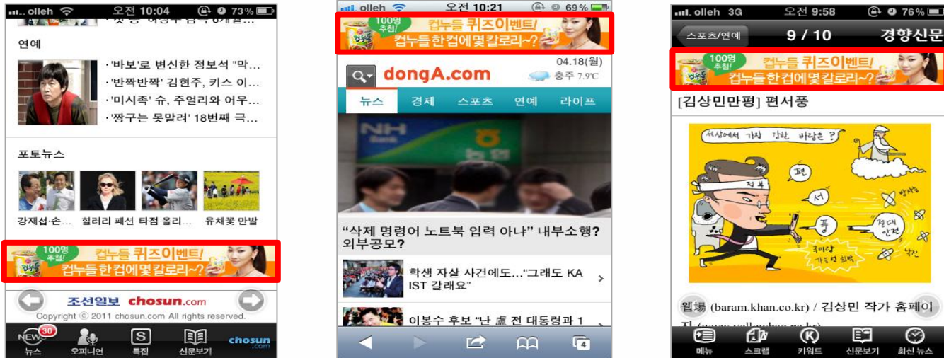
< MMAN(엠맨) 모바일 애플리케이션 & 모바일 웹 배너 >