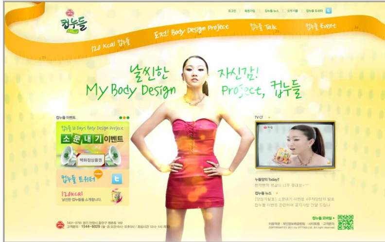
<컵누들 메인 페이지>