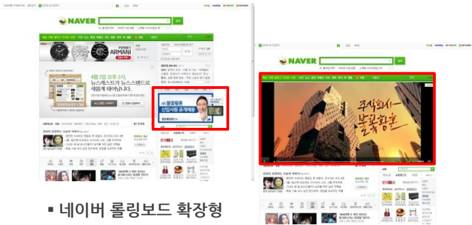
■ 네이버 롤링보드 확장형