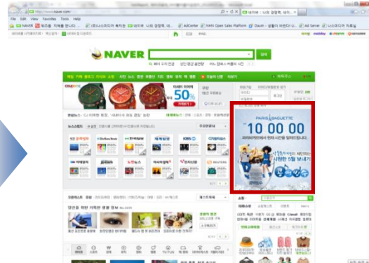
시보광고 기본배너(확장 후)