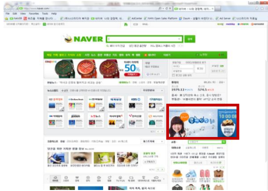
시보광고 기본배너(확장 전)