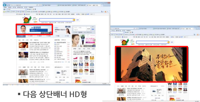
■ 다음 상단배너 HD형