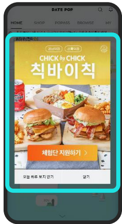
3일 400만원 / 7일 1,000만원 앱 실행시 첫 화면 노출